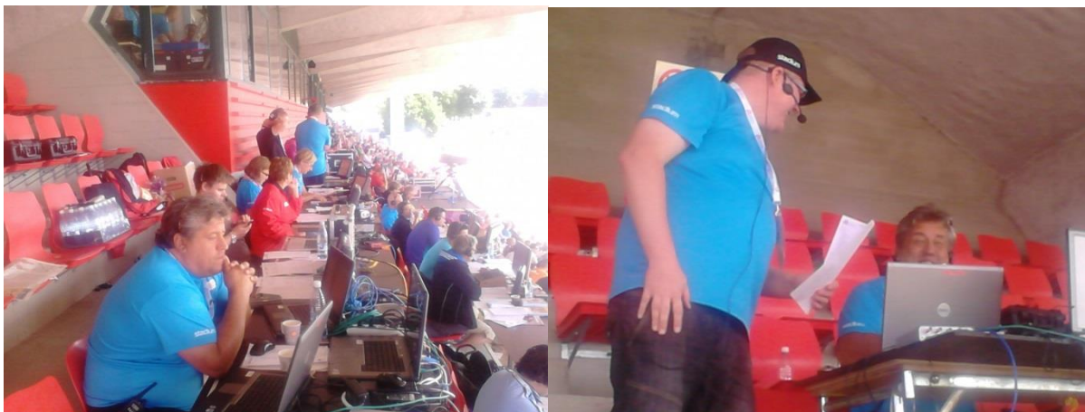
Informaatorite töölaud, paremal pildil üks sümpaatsematest informaatoritest

Pildilise teabe tarvis olid Tampere staadionil kõrvuti töös tulemustetabloom ja videoekraan. Tabloom oli oma aja võrdlemisi ära elanud mitmest paneelist koosnev ekraan, mis aeg-ajalt ikka streikis ning suutis näidata korraga ainult seitsme võistleja tulemusi. Iseäranis häiris see, kui oli soov teada saada jooksude tulemusi või mõne ala finaliste. Videoekraan edastas samal staadionil toodetud YLE televisiooni pilti, mis oli küll kena, ent graafika oli võrdlemisi kehvasti loetav.