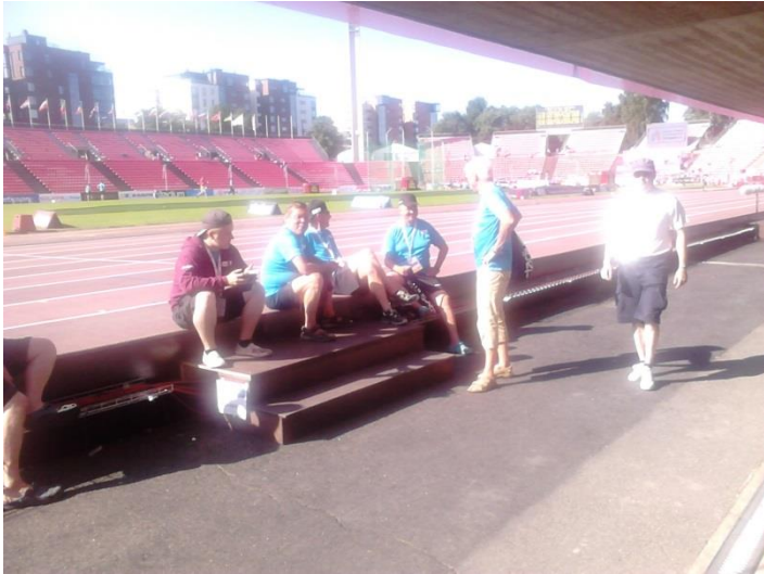
Rühm kohtunikke teise võistluspäeva eel

punased kilejoped. Samas polnud mingeid riietumisinstruktaaze kohtunikele antud. Jalas võis kohtunikel näha kõikvõimalikus pikkuses ja laiuses seelikuid, pükse ja mõnel ka retuuse. Nimetatud särki kanti küll nende peal, sees kui ka nabapluusiks keeratuna. See jättis mõistagi lohaka mulje. Nagu ka kohtunike liikumine võistluspaikadesse. Sinna liiguti küll koos, aga mitte rivis. Tihti võis ka näha, et kohtunikud viisid võistluspaika kaasa isiklike esemeid küll suuremates, küll vähemates kottides. Kohtunike kiituseks võib öelda, et võistluspaikadesse jõudnuna isetegevust ei tehtud ja täideti täpselt ettenähtud ülessandeid.