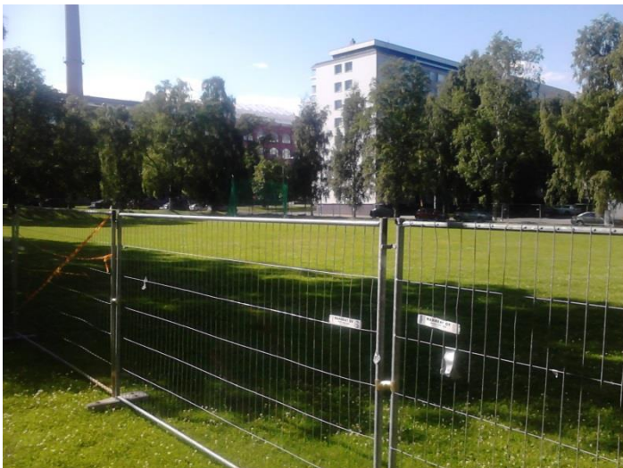
Pikkade heidete soojendusala Tamperes

See kõik tegi kogu pildi kirjuks, olemise kilukarbilikuks ning sportlastele soojategemist ilmselt mitte väga soosivaks. Pikema soojendusjooksu tegemiseks olid korraldajad eraldanud ka staadioni kõrval asuva looduslikult küll kauni, ent hoopis muud eesmärki täitva järveäärse pargi koos kruusarajaga. Pikkade heidete jaoks tuli võistlejatel liikuda staadionilt umbkaudu 500 meetrit välja ühele lihtsale, elumajade vahel asuvalle haljasalale, kuhu oli kohale toodud kaitsevõrguga heitering, kaks soojakut ning sanitaarkonteinerit (väli WC-d). Õnneks oli haljasala piiratud ajutiste aedadega ning sealsed heited ehk ohtu ümbritsevale elu-olule ei kujutanud.