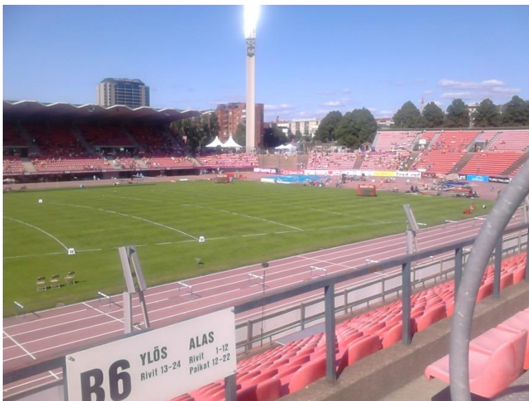
Tampere Ratina staadion

Hoolimata sellest, et Tampere on tegemist pargi tüüpi staadioniga, tõusevad tribüünid seal üsna järsult ja üsna kõrgele, tekitades nn. katla efekti ning loovad võistlejatele korraliku ergutamise korral üsna mõnusa fooni.