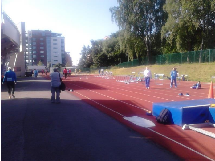
Soojendusala staadioni kõrval

Suur oli meie üllatus kui ilmnes, et Tampere staadion on sootuks ilma soojendusstaadionita. Võistlejate soojenduseks oli ette nähtud ühe otsatribüüni taga asuv kuue rajaga 100 meetrine sprindisirge, mis tubli kolmandiku ulatuses oli veel erineva inventariga (tõkked, teibamatt) kaetud. Lisaks üks kaugushüppe kast ning kuulitõukesektor, mida kasutada ei saanud. Soojendusareeni kõrval asusid ka võistlejate kogunemiskohaks mõeldud telgid ning otsatribüüni all võistkondade massaažiboksid.